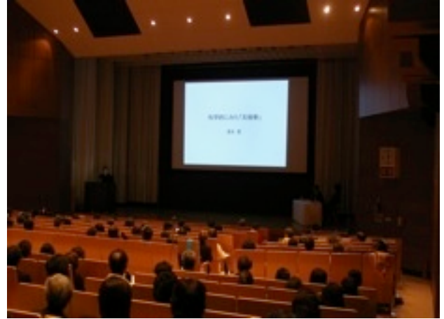
▲長井記念ホール (サブ会場)