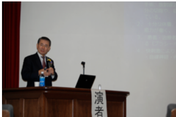
第一部 講演会「統合医療の現状」の様子。