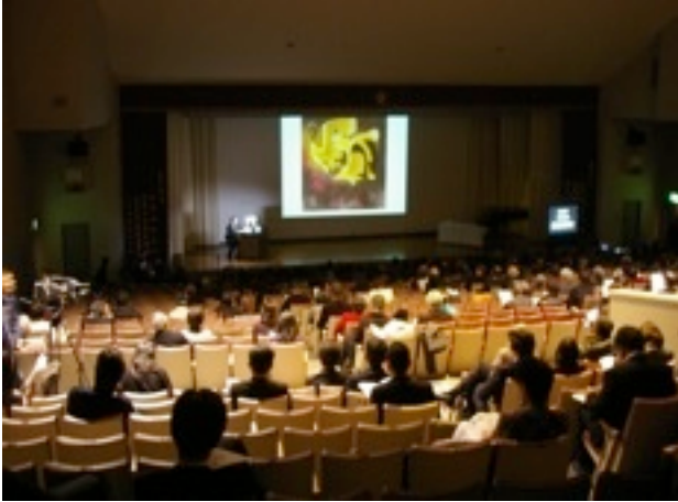
▲大塚講堂 (メイン会場)